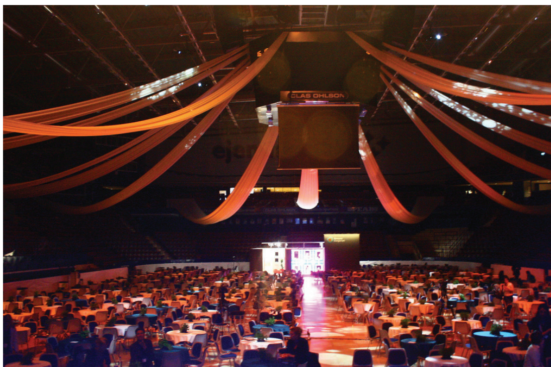
The big plenary room.

“There are 272 rivers that are shared by more than two countries. There is no international law that governs water properly and only one international treaty dealing with water.